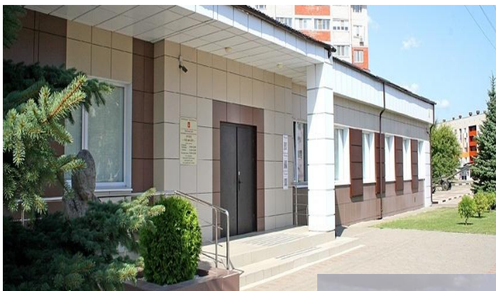
Шебекинский историко- художественный музей